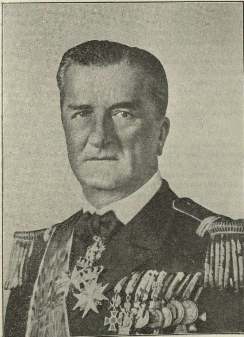
Nagybányai vitéz Horthy Miklós Magyarország kormányzója.